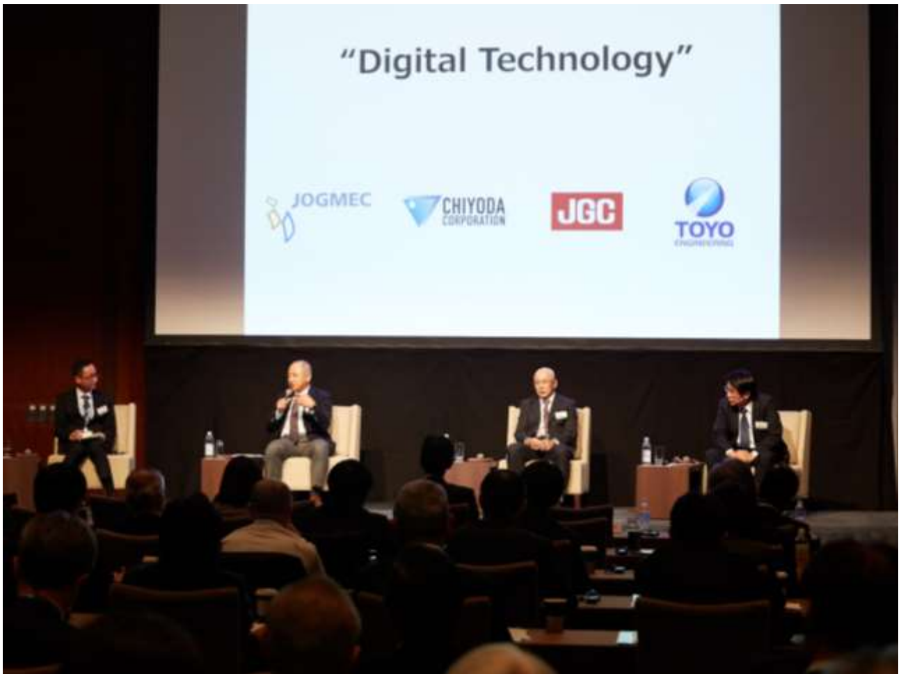
技術セッション2【デジタル技術】:パネルディスカッション テーマ:『資源開発とデジタル技術』