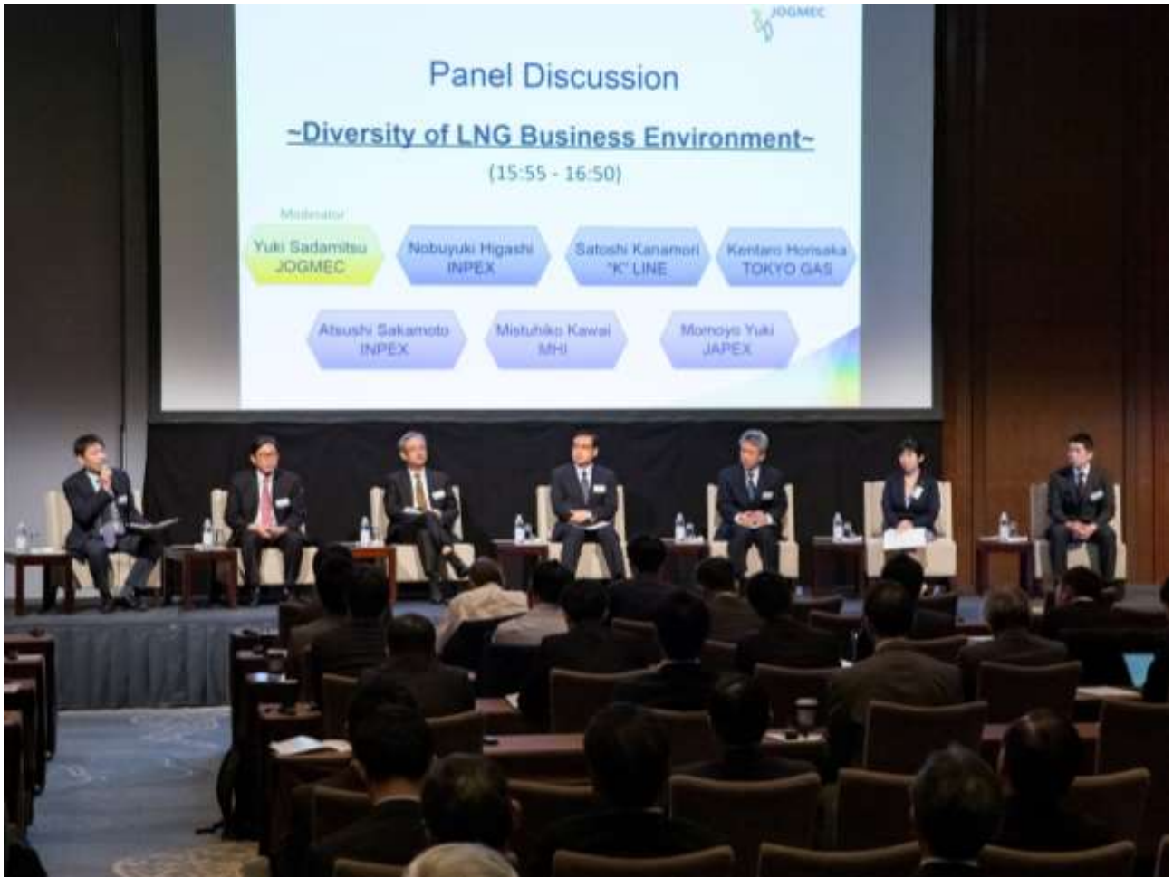
技術セッション1【ガス・LNG】:パネルディスカッション テーマ:『多様化する LNG ビジネス環境』